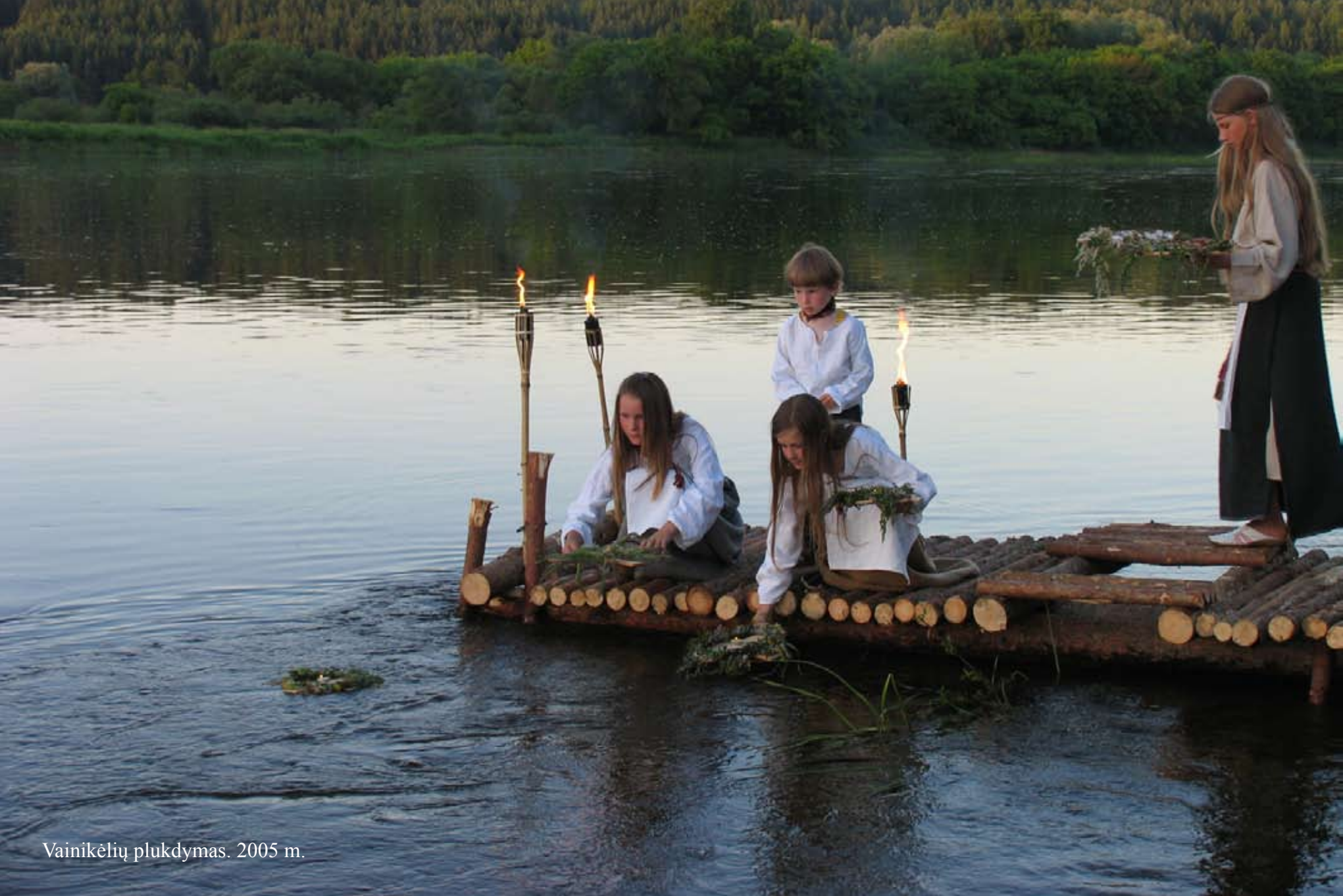
Vainikėlių plukdymas. 2005 m.