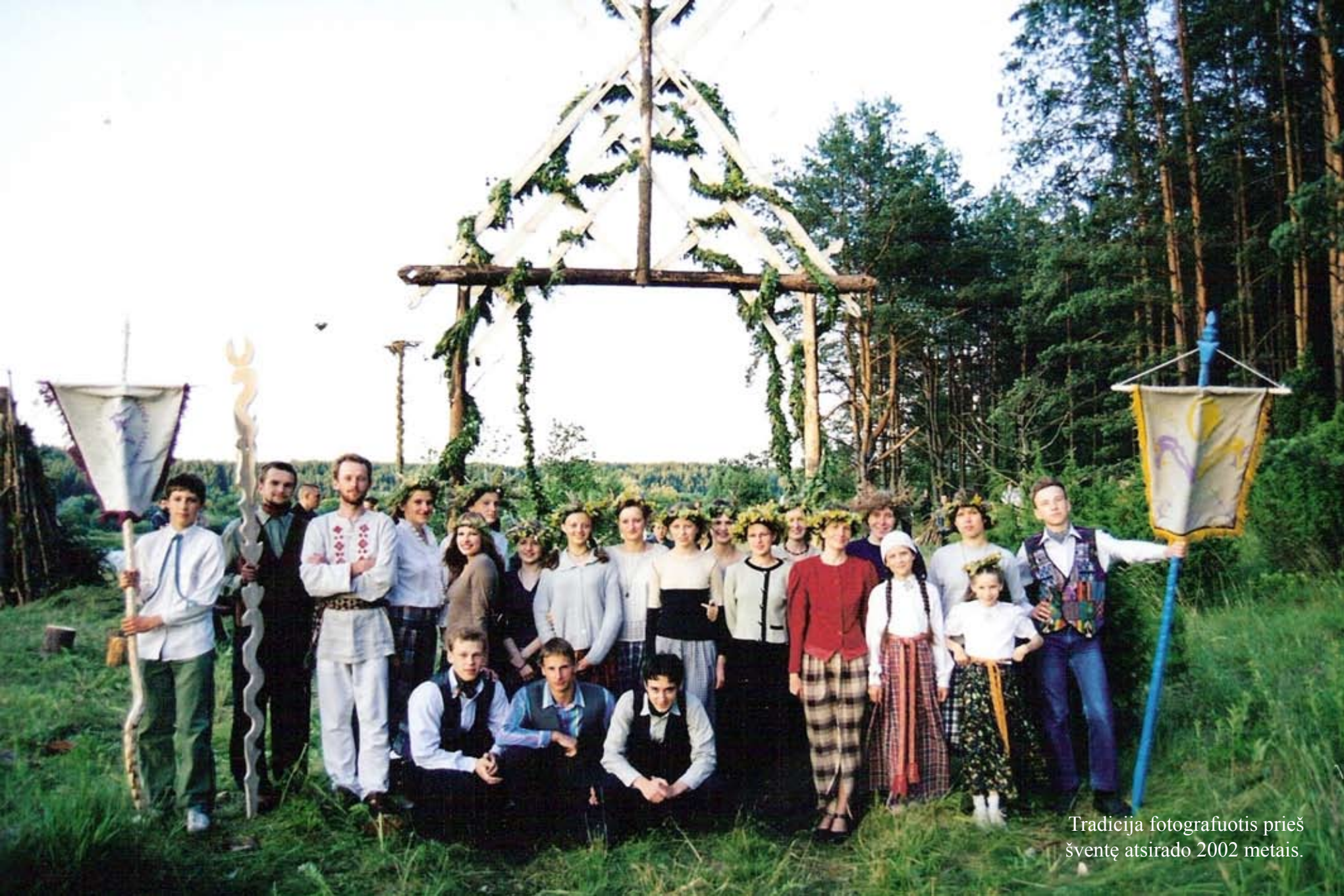
Tradicija fotografuotis prieš šventę atsirado 2002 metais.