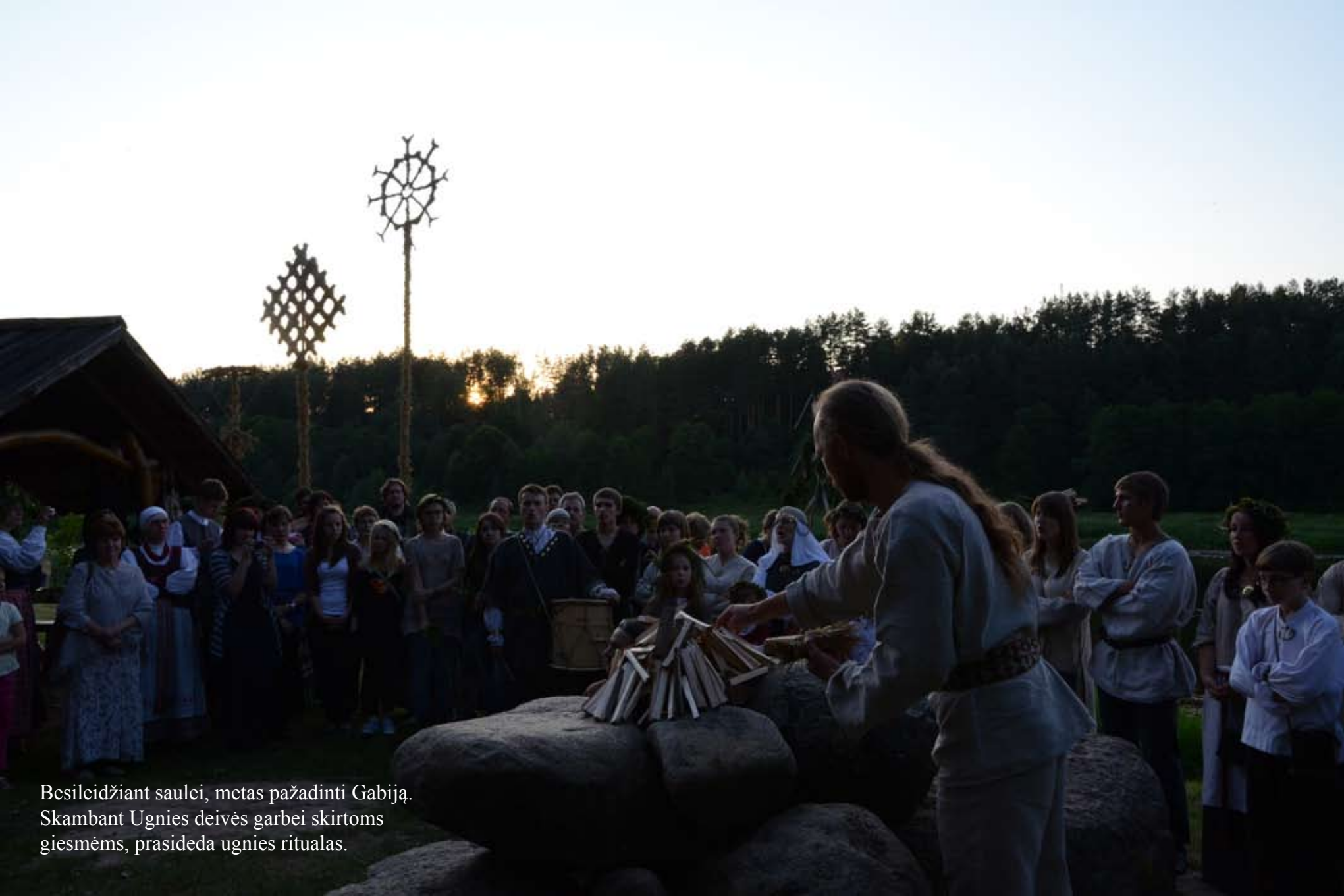
Besileidžiant saulei, metas pažadinti Gabiją. Skambant Ugnies deivės garbei skirtoms giesmėms, prasideda ugnies ritualas.