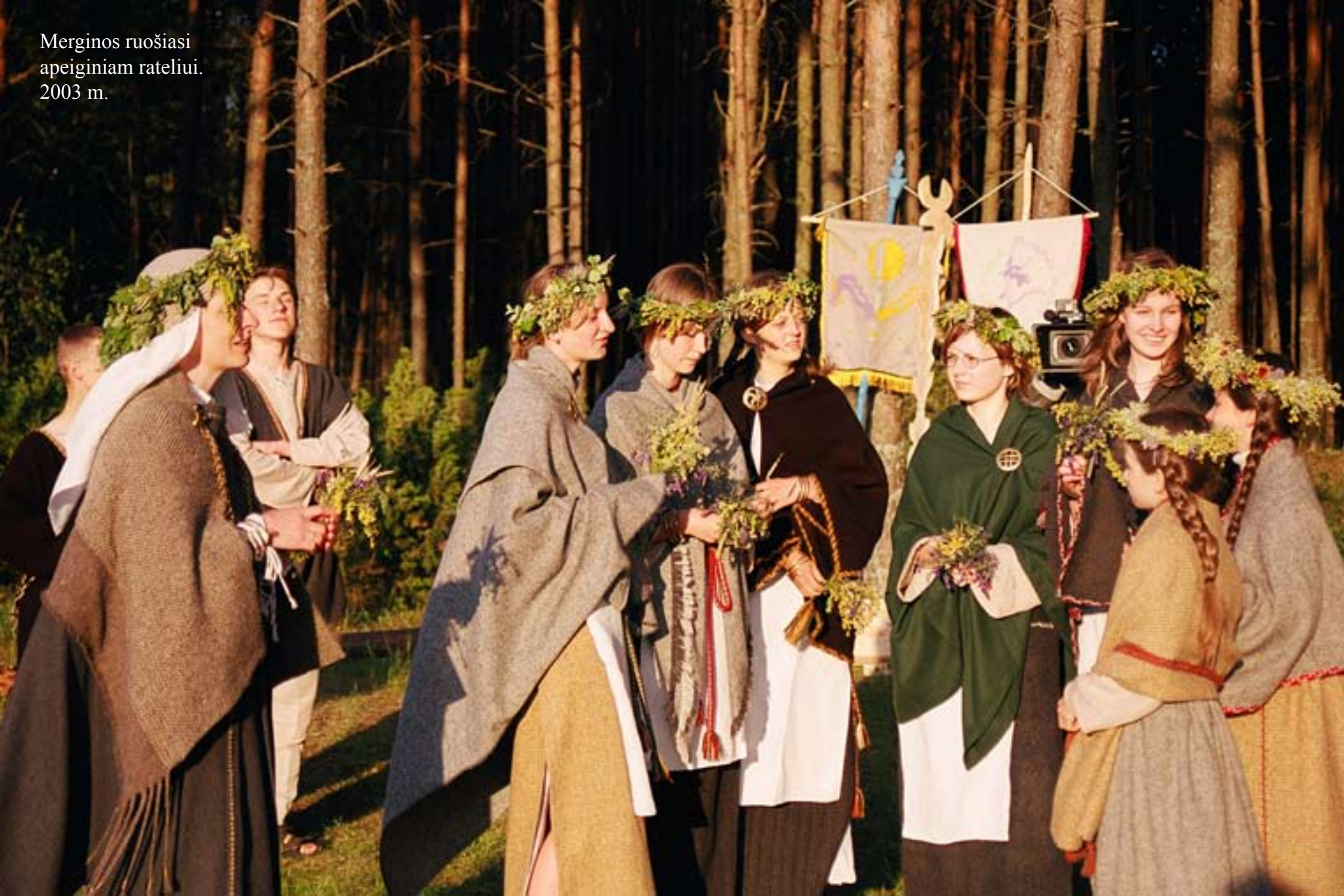
Merginos ruošiasi apeiginiam rateliui. 2003 m.