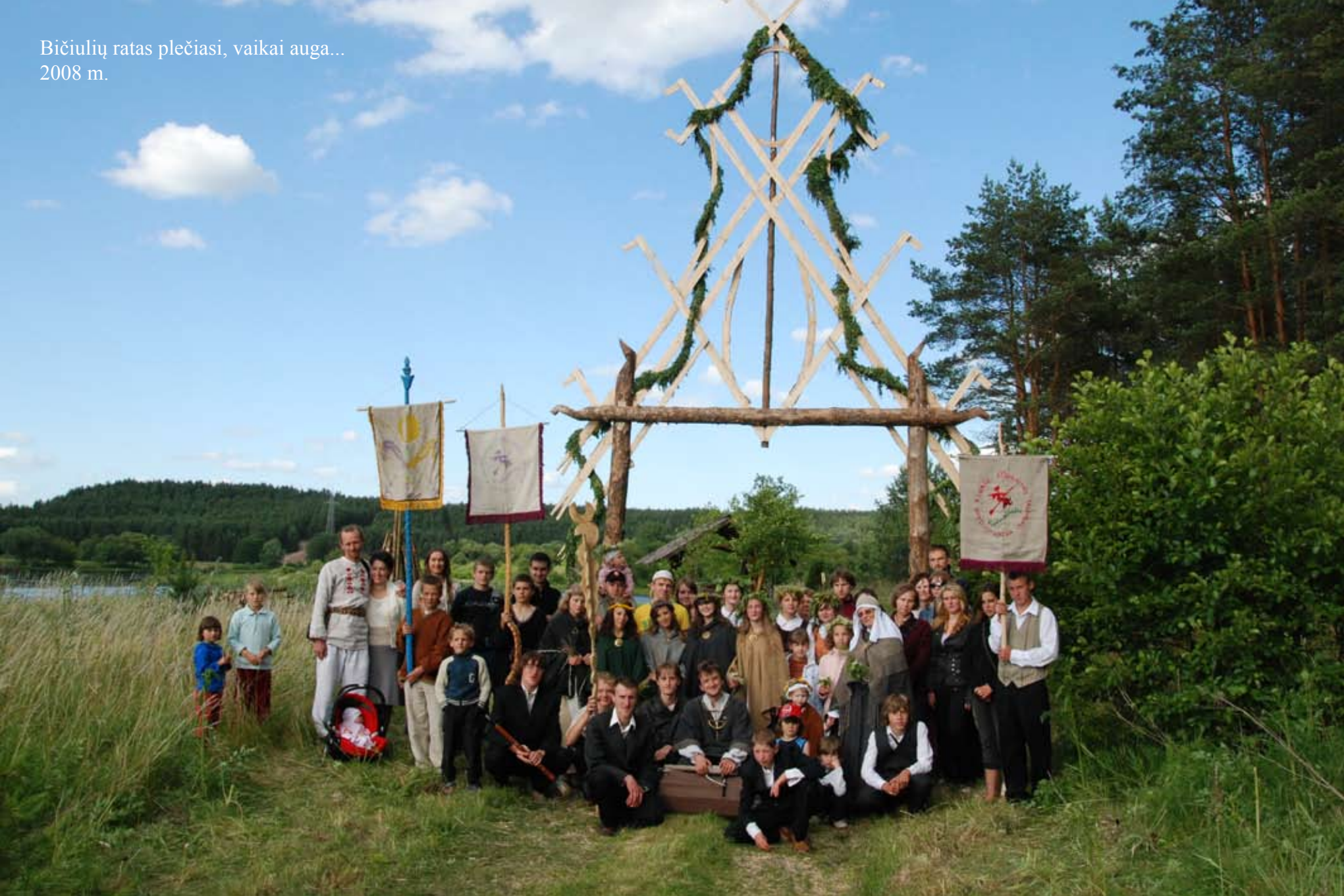
Bičiulių ratas plečiasi, vaikai auga... 2008 m.