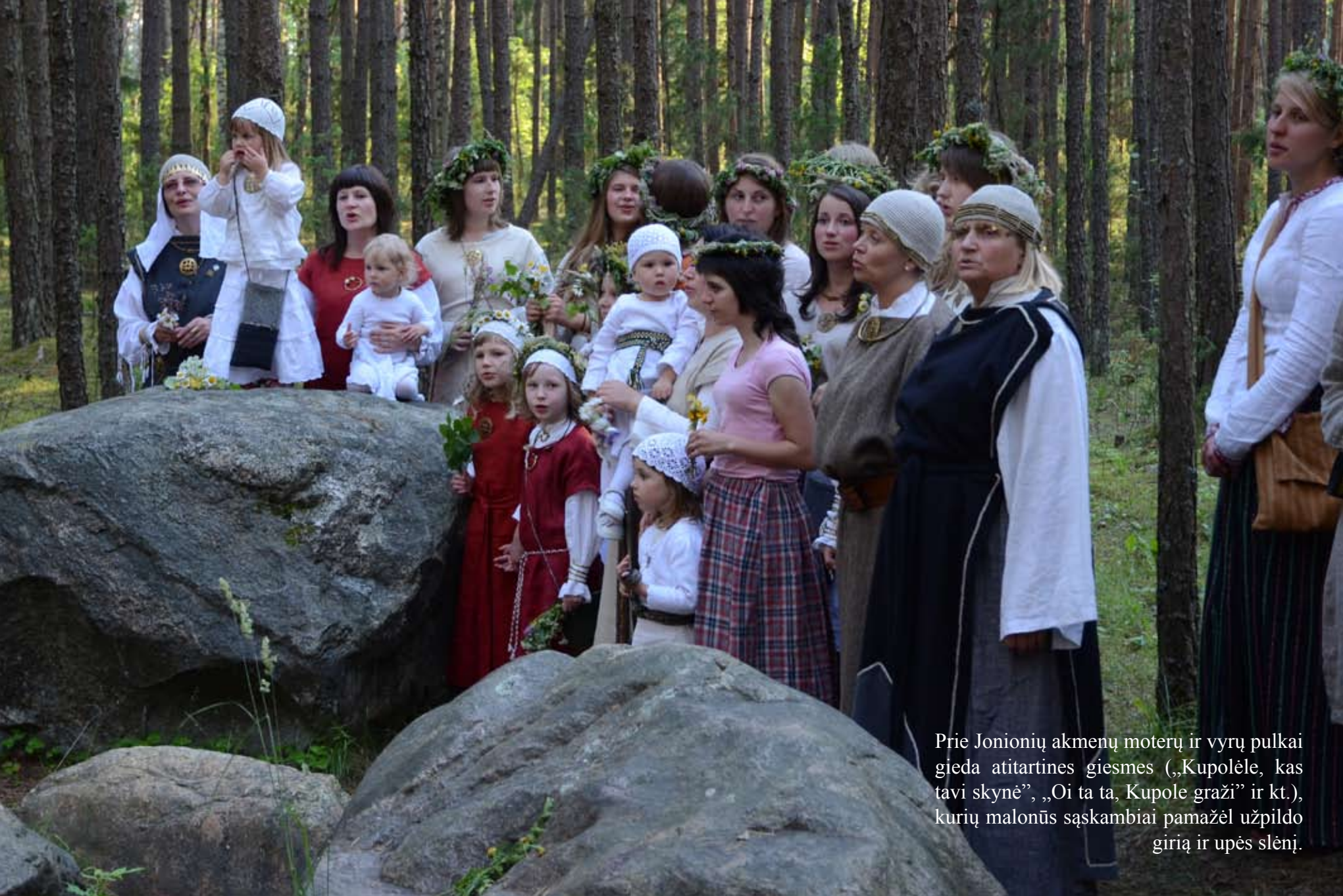
Prie Jonionių akmenų moterų ir vyrų pulkai gieda atitartines giesmes („Kupolėle, kas tavi skynė“, „Oi ta ta, Kupole graži“ ir kt.), kurių malonūs sąskambiai pamažėl užpildo girią ir upės slėnį.