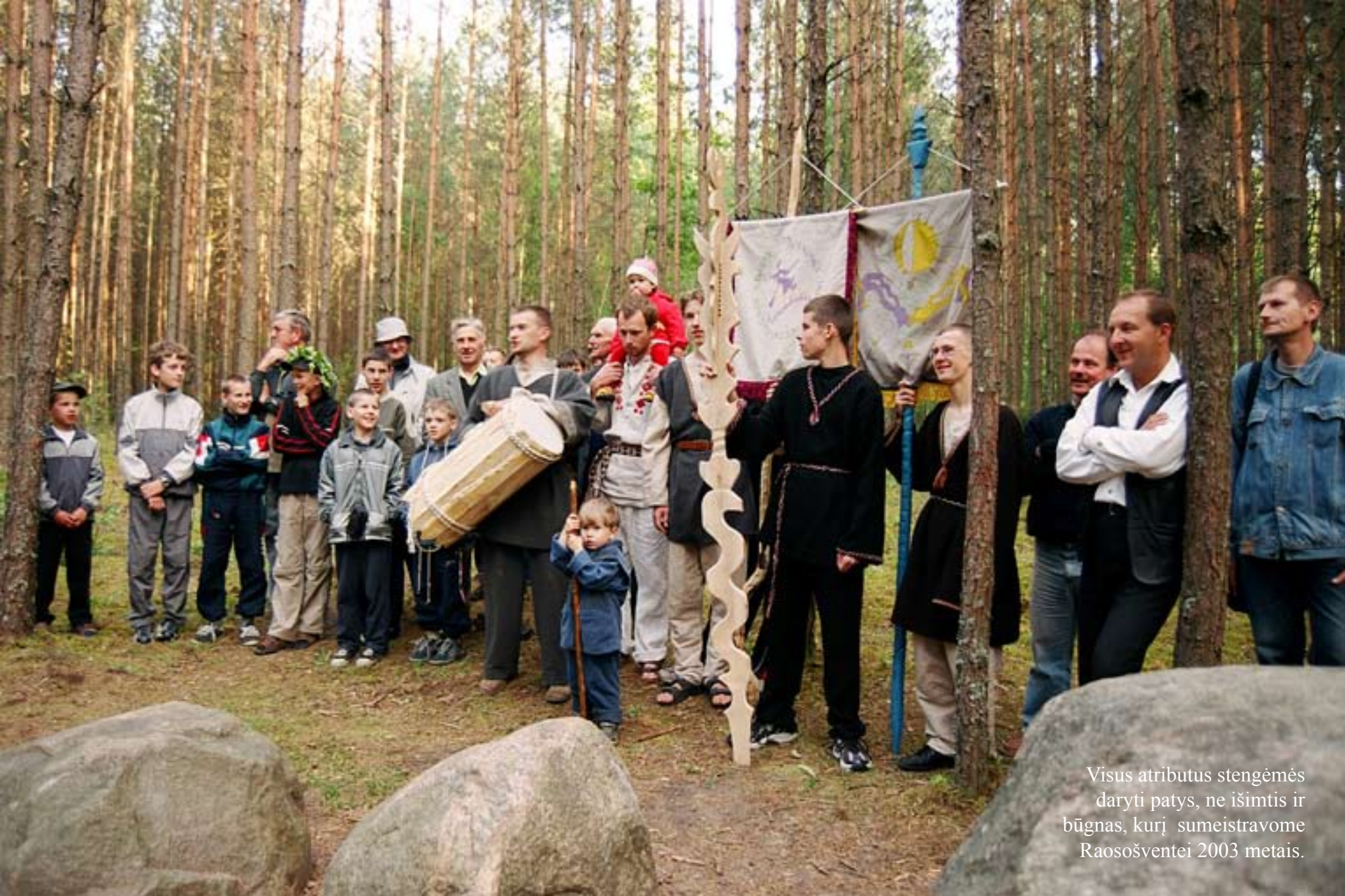
Visus atributus stengėmės daryti patys, ne išimtis ir būgnas, kurį sumeistravome Raosošventei 2003 metais.