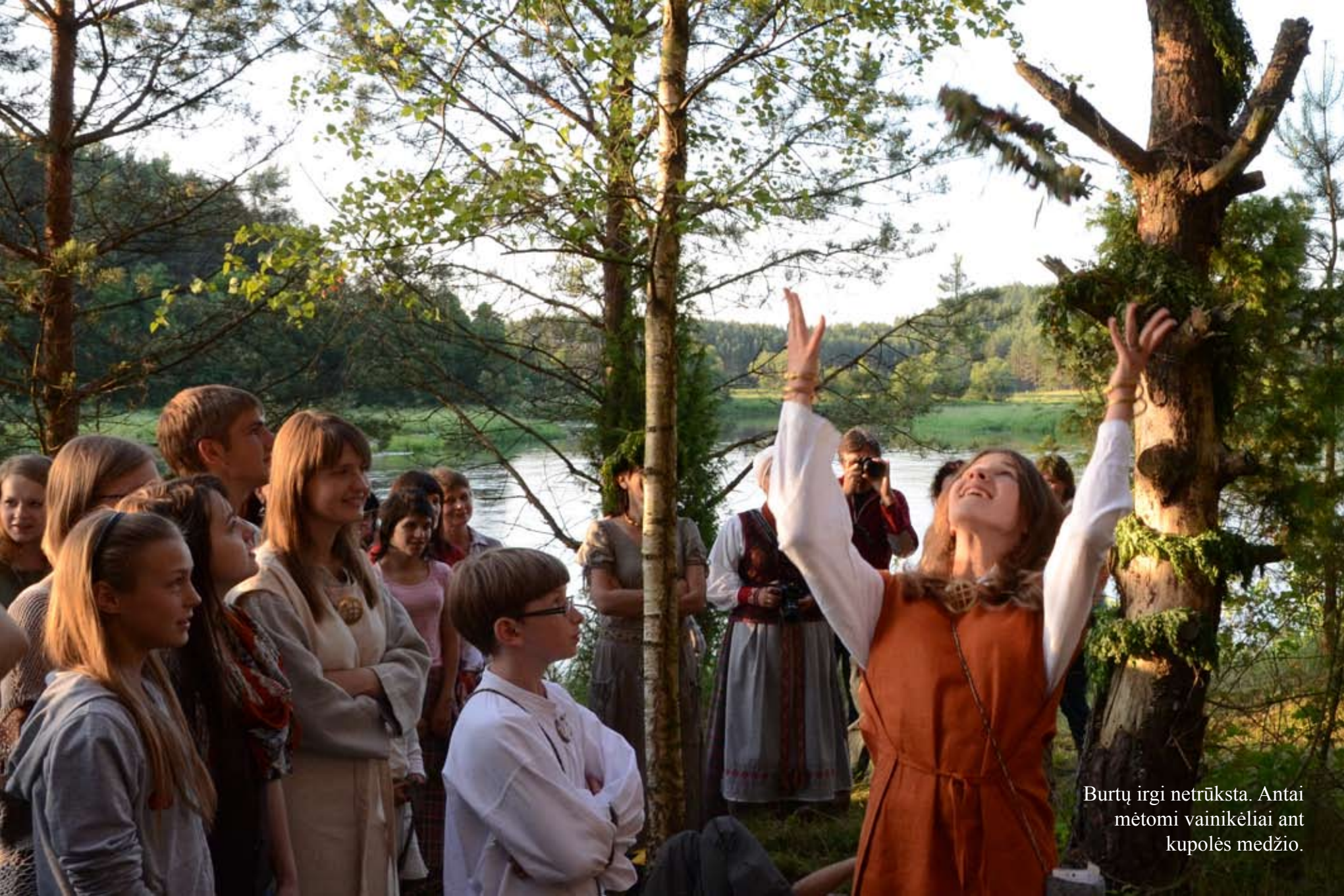
Burtų irgi netrūksta. Antai mėtomi vainikėliai ant kupolės medžio.