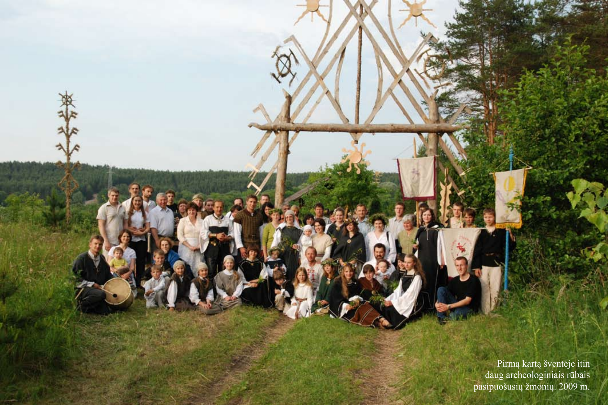
Pirmą kartą šventėje itin daug archeologiniais rūbais pasipuošusių žmonių. 2009 m.