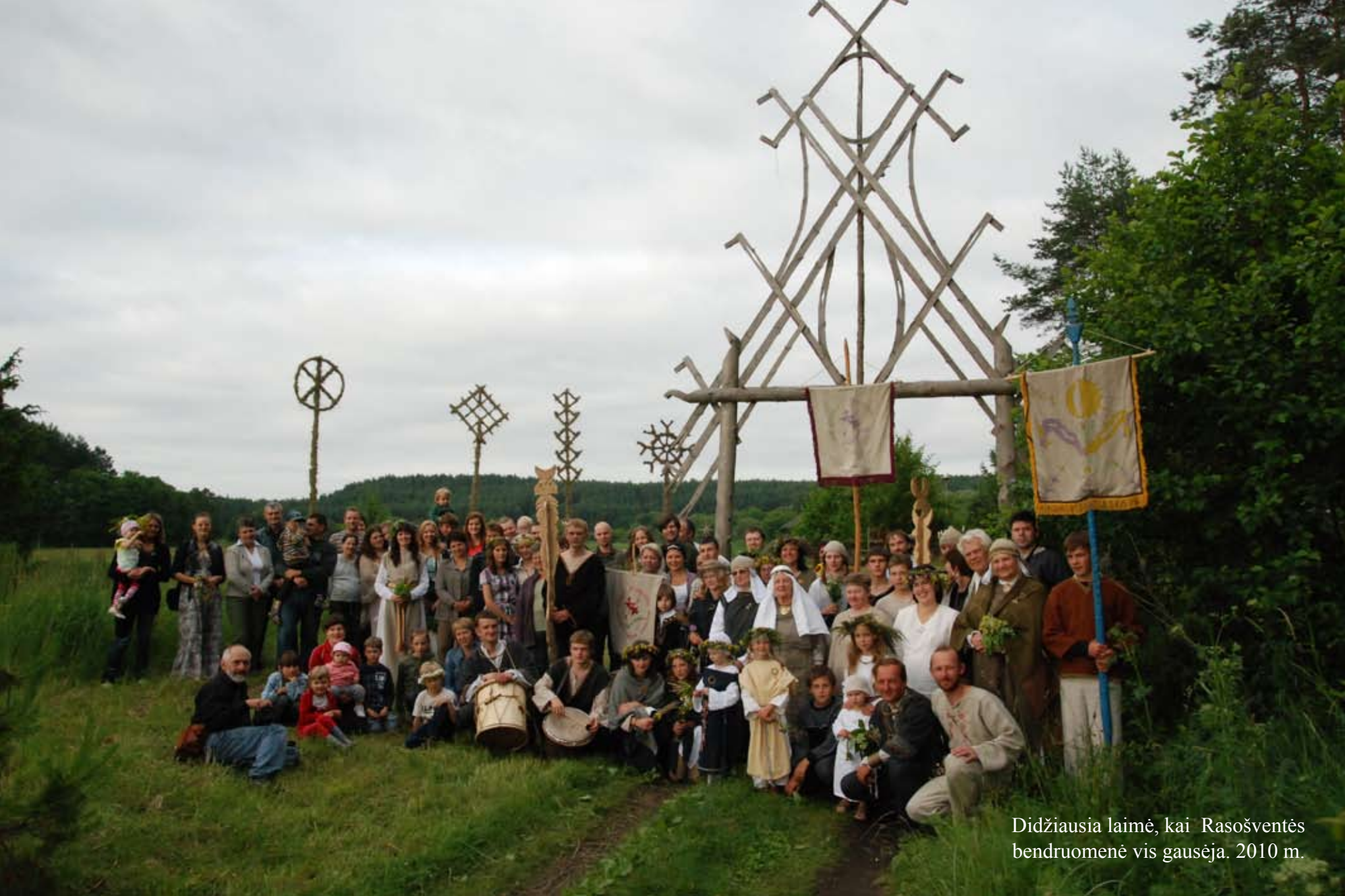
Didžiausia laimė, kai Rasošventės bendruomenė vis gausėja. 2010 m.