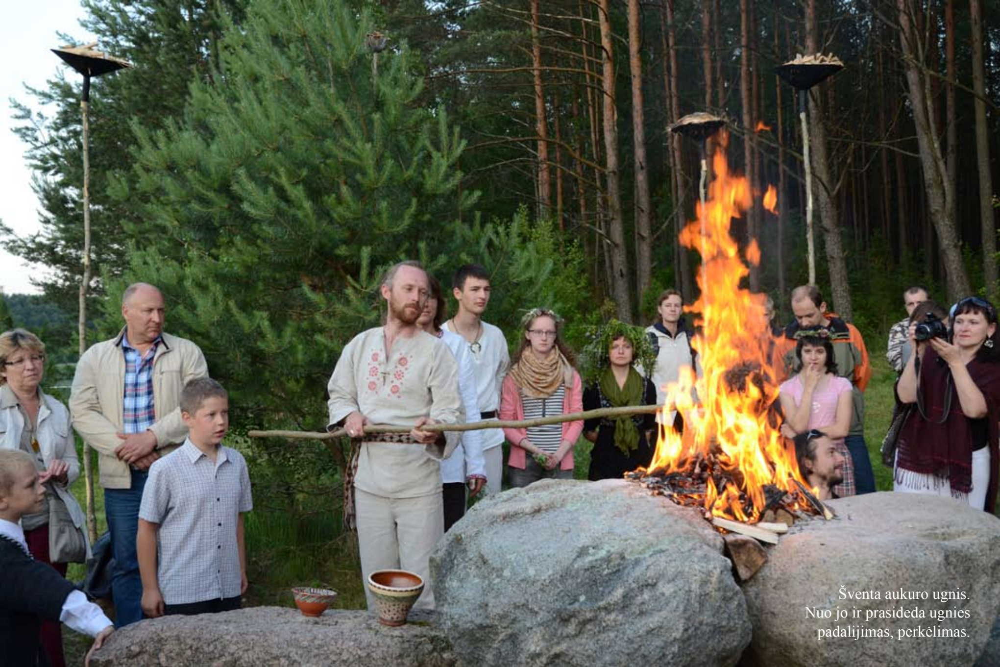
Šventa aukuro ugnis. Nuo jo ir prasideda ugnies padalijimas, perkėlimas.