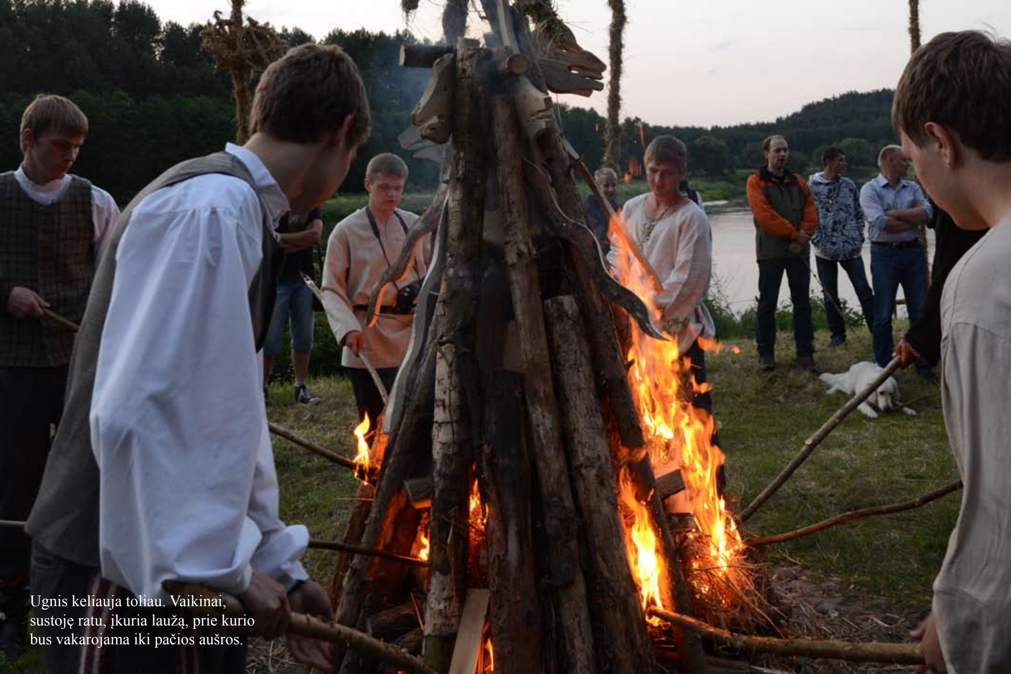
Ugnis keliauja toliau. Vaikiniai, sustoję ratu, įkuria laužą, prie kurio bus vakarojama iki pačios aušros.