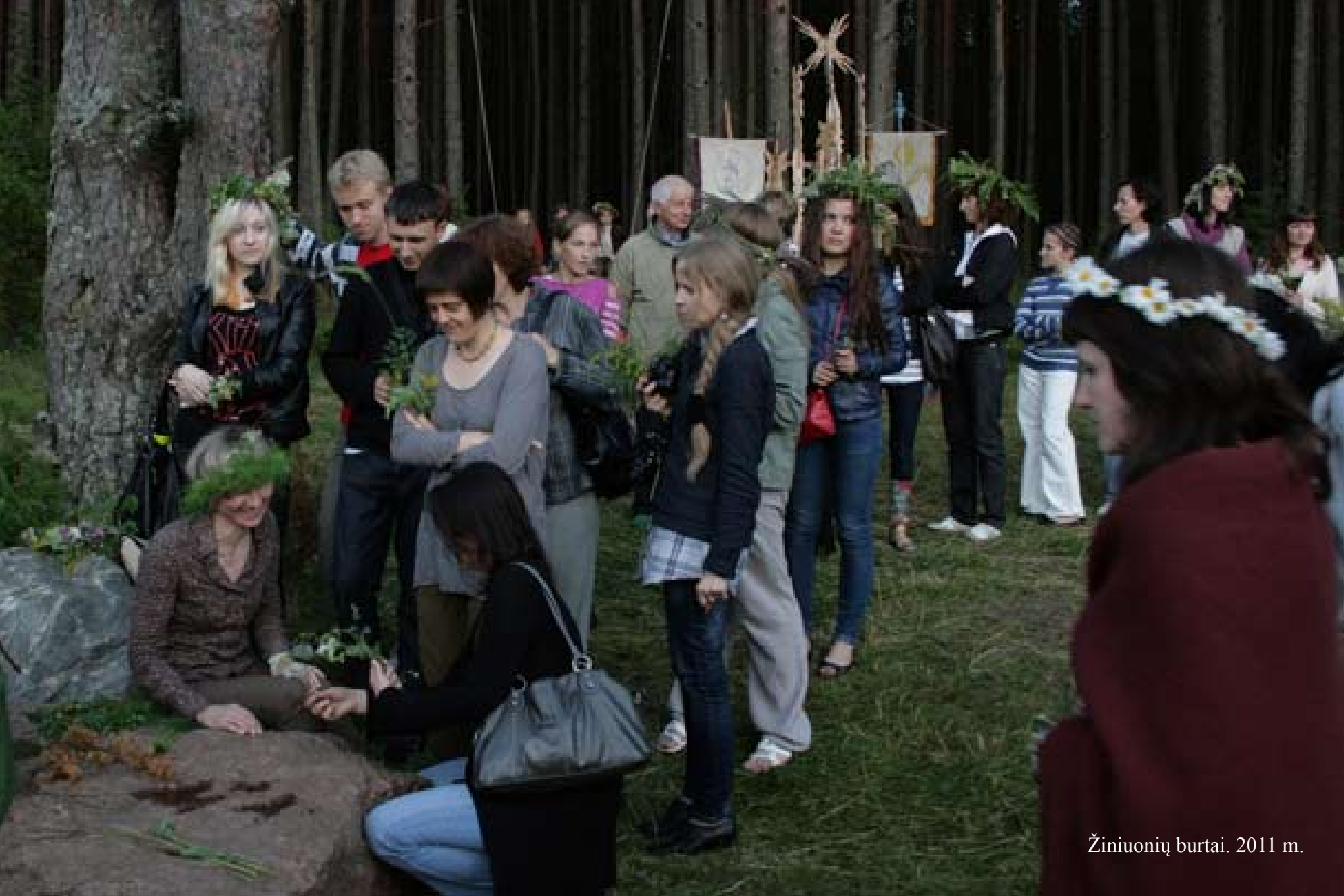
Žiniuonių burtai. 2011 m.