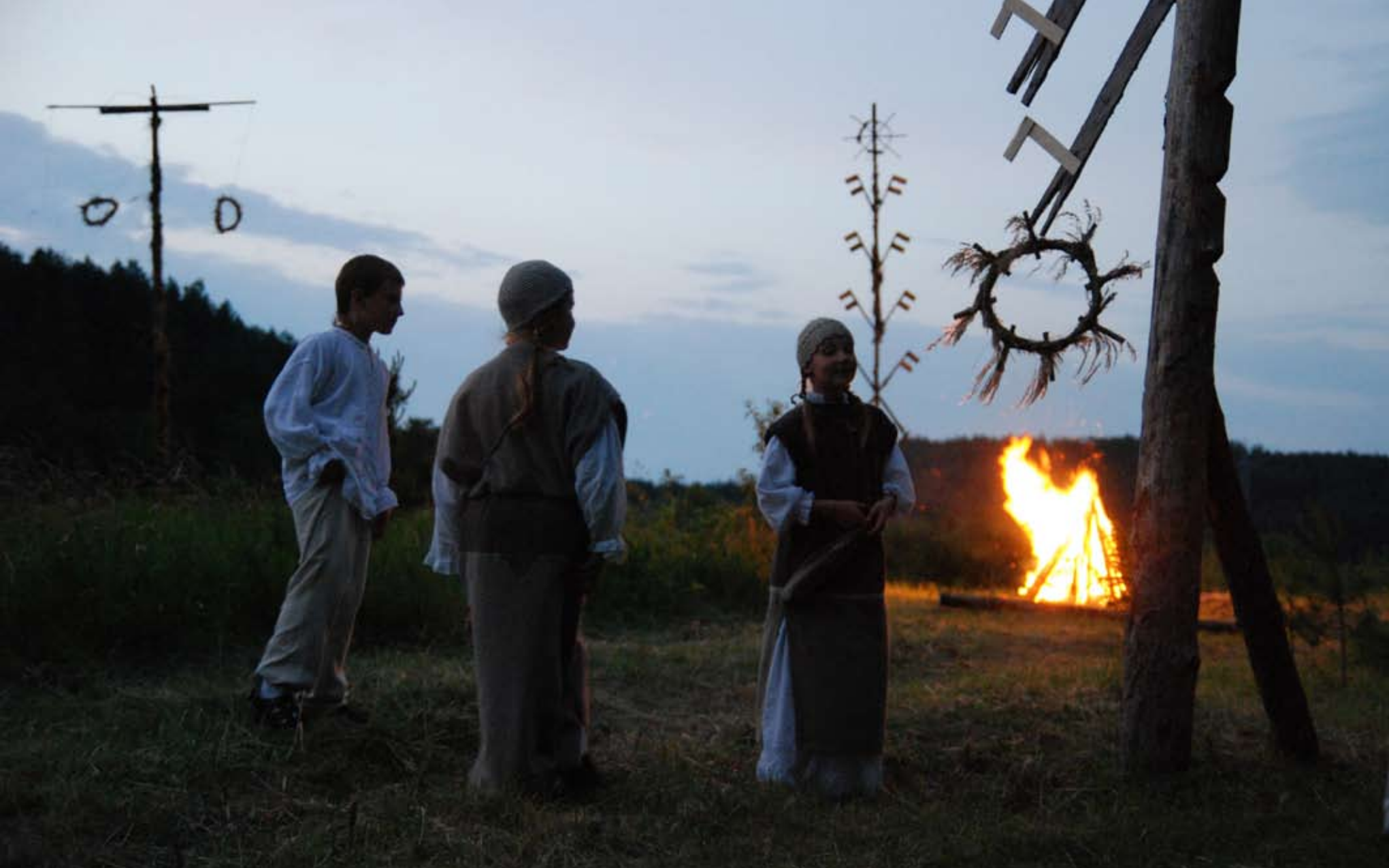
Prasideda trumpiausia naktis. 2009 m.