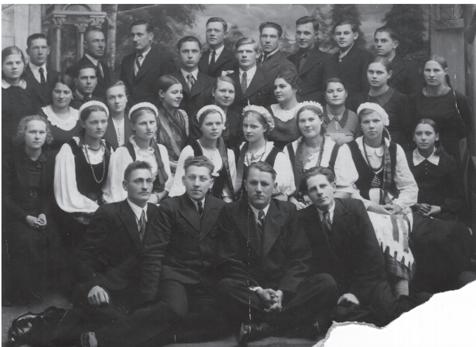
Nežinomo autoriaus nuotraukoje: Merkinės jaunalietuvių choras 1938 m.

Paprastai. Mintis labai sena, tik iki šiol to daryti nesiryžau. Kad Merkinė turi turėti chorą, juk visiems aišku. Ir dėl savos istorijos, ir dėl čia gyvenančio talentingo jaunimo. Su jaunimu jau kurį laiką esame susibūrę į bažnytinį chorą pavadinimu „Asti“. Darbas su šiuo choru ir subrandino mintį pabandyti praplėsti akiratį, suburti kolektyvą ne tik bažnytiniam giedojimui, bet ir dainavimui. Malonu, kad į šį kolektyvą be gausaus būrio vietinių merkiniškių noriai įsijungė ne Merkinėje gyvenantys, bet iš čia kilę arba čia dirbantys, Merkinei simpatijas jaučiantys dainininkai iš Vilniaus, Varėnos, Ratnyčios, Druskininkų.