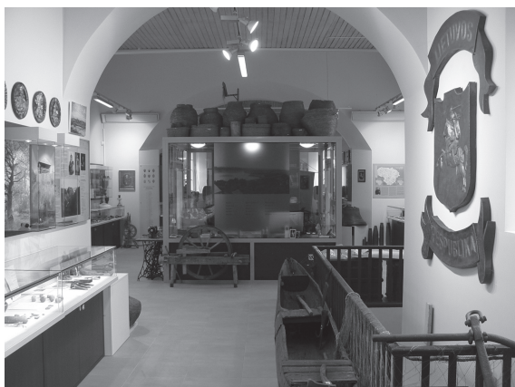
Muziejus vidus po renovacijos.

Per kraštiečių suvažiavimą praėjusių metų rudenį muziejaus direktorius gan optimistiškai žarstė pažadus apie atidarymo datą, net nenumanydamas, kad šią teks atidėti bent 3 kartus. Muziejus per tą laiką teikė paraiškas ir gavo finansavimą dviems projektams, kuriuos įgyvendinus įsigyta kompiuterinė ir įgarsinimo įranga, projektorius, ekranas, sukurtas rotušės maketas, sumaketuoti ir įrengti ekspozicijos stendai. Šių stendų sukūrimas buvęs didžiausias iššūkis. Šiandieną belieka tik padėkoti tiems, kurie prisidėjo prie naujos ekspozicijos sukūrimo ir įrengimo.