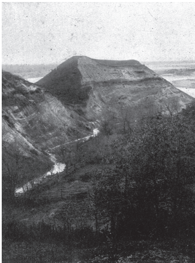
Merkinės piliakalnis XX a. pradžioje.

Slaptuos puslapiuose vėl blaivysis sužlugęs bajoras, nykštukai ugnelę kūrens prie Milžinkapio, perdegs naktis, ir ištarsiu skaidrėdamas dūmuose: jums, mano broliai, garbė, pinigai, gražios moterys. Man – kas jau liks.