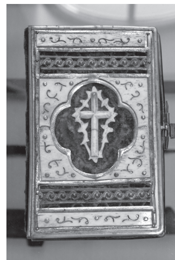
XIX a. maldaknygės viršelis