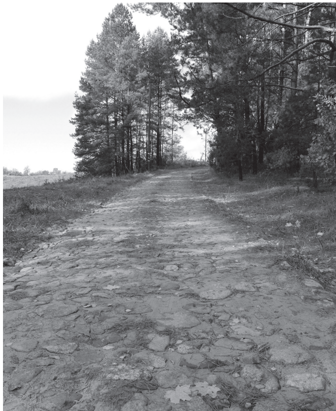
Senasis kelias į Ricielius prie Tenenės daubos. Šituo keliu iš Liškiavos galima buvo pasiekti ir Liepiškius, nors buvo ir trumpesnis kelias.