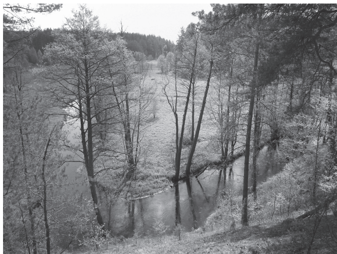
Grūdų upė. Vaizdas nuo Šaudyklos kalno.

Dorupio upelis, pratekėjęs pro Marcinkonis, už vakarinio kaimo pakraščio įteka į Grūdą. Grūdų vagos plotis ties Marcinkonimis siekia 4 – 6 metrus. Išskirtinis Grūdų upės bruožas – nepaprastai gausūs ir vaizdingi jos vingiai bei senvagės. Ši