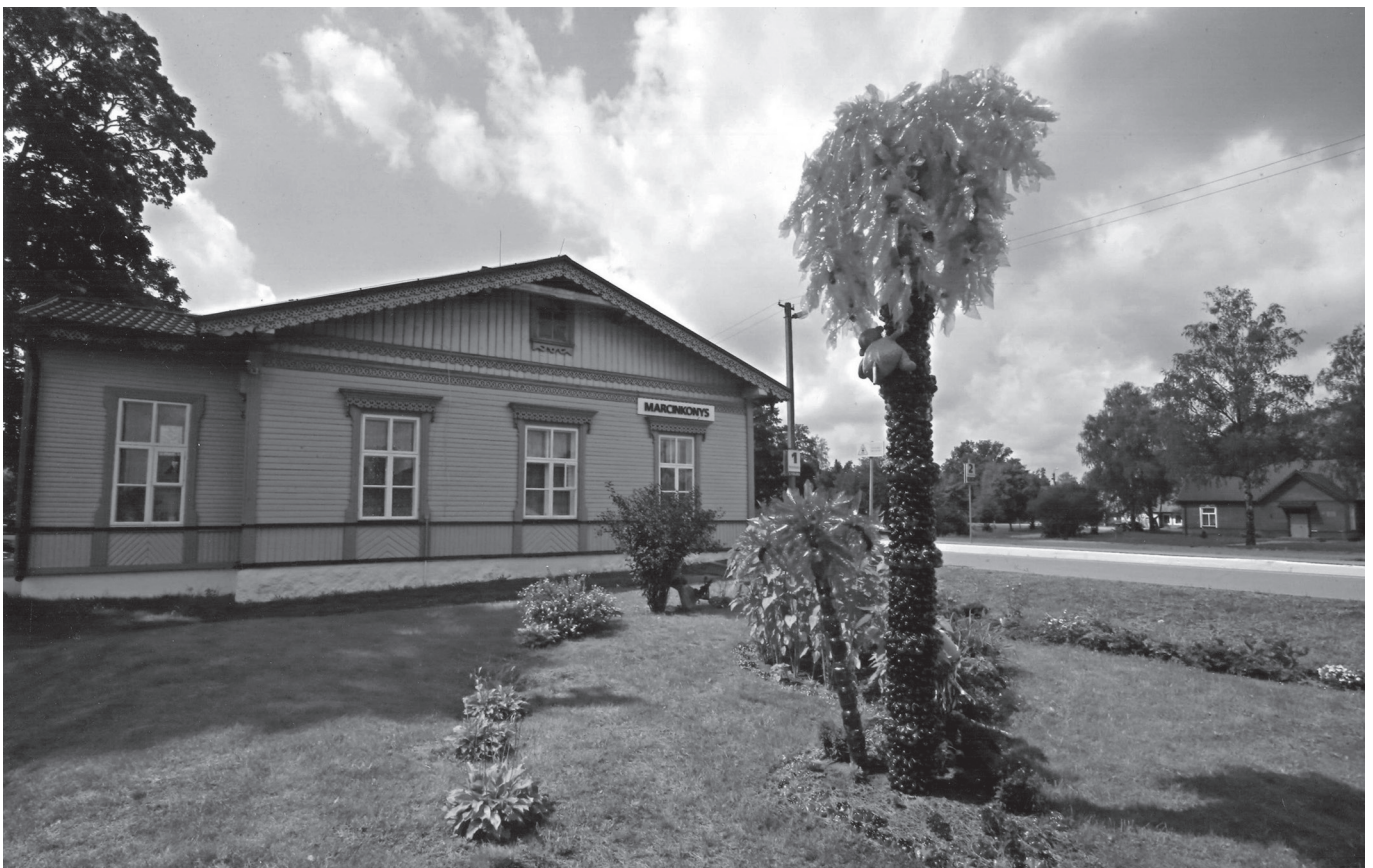
„Stambus regiono geležinkelio mazgas“