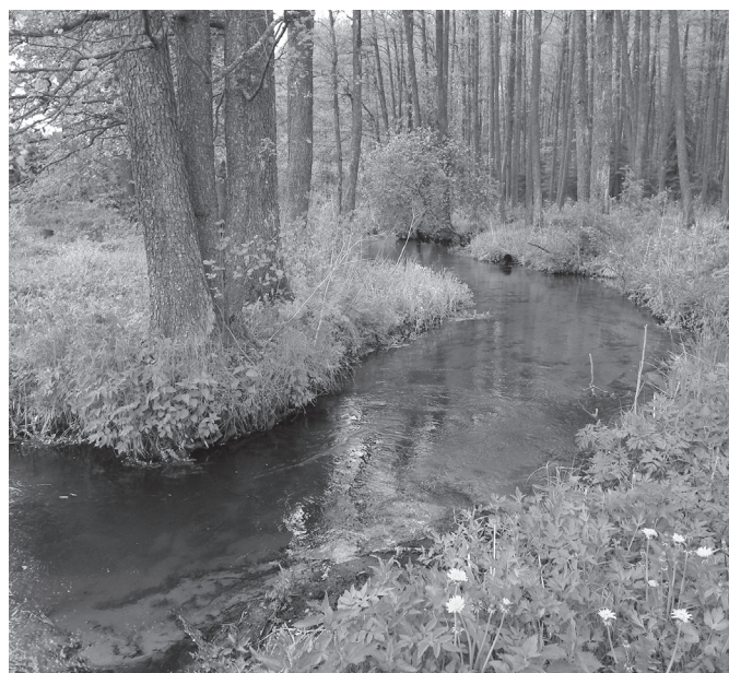
Dorupio upelio žemupys.

upė – viena labiausiai vingiuotų upių Lietuvoje. Kai upė, patrupindama sau kelią, pralaužia susidariusią siaurą sausumos sąsmauką, atitrūkęs vingis tampa senvage, kuri ilgainiui pradeda užpelkėti, o upė vėl pradeda formuoti naują vingį ir taip šis procesas kartojasi. Kai upės vingiai priartėja prie aukštesnių šlaitų, prasideda intensyvus krantų ardymas – skardžių formavimas. Gražiausias skardis šalia Marcinkonių vadinamas Šaudyklos kalnu. Tokį pavadinimą skardis gavo todėl, kad XX a. tarpukaryje ir Antrojo pasaulinio karo metu čia buvo įrengta šaudykla. Šio smėlingo skardžio aukštis siekia 13 metrų. Nuo jo atsiveria įspūdingas Grūdų slėnio vaizdas. Dabar čia dažnai lankosi turistai, kurie atvyksta į Dzūkijos nacionalinį parką.