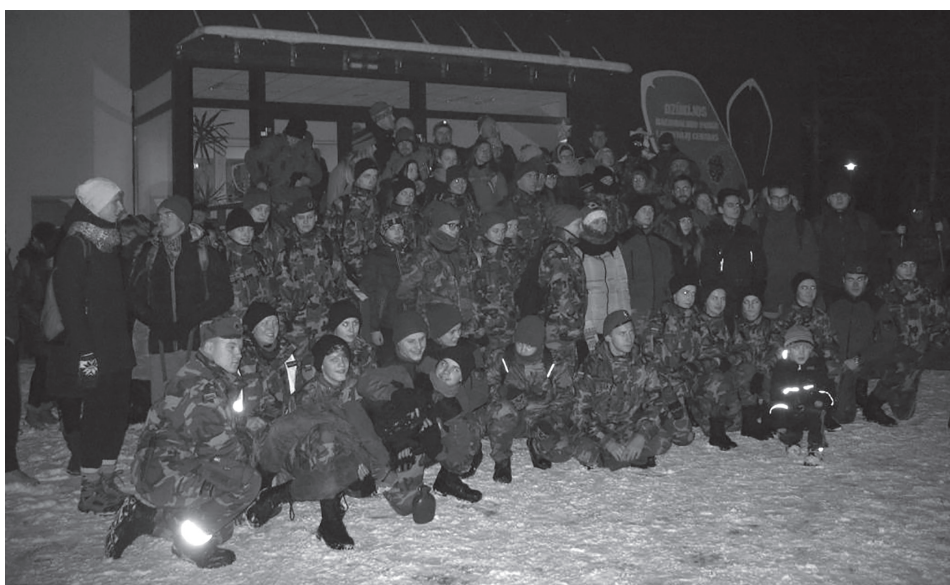
Žygio dalyviai prie Marcinkonių lankytojų centro.