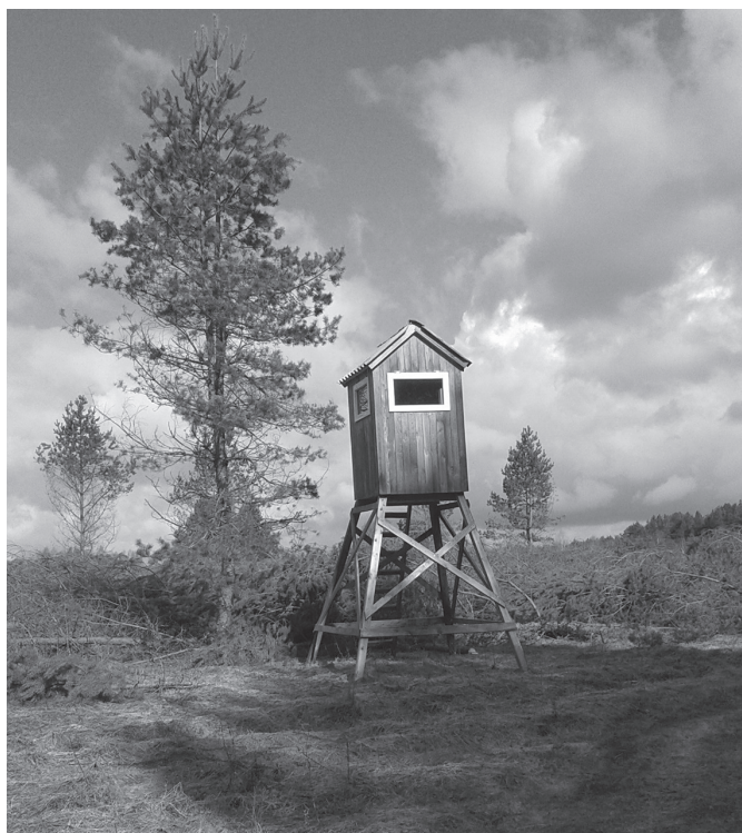
Šitokie medžiotojų bokšteliai ir šėryklos kartais pasitarinau kaip svarbūs migraciniai orientyrai šernams, keliaujantiems iš dienos slėptuvių į avižų ir bulvių laukus. Todėl medžiotojai net nejaučia, kad šitokiu būdu ūkininkai patiria dar didesnę žalą.