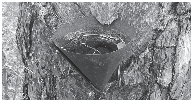
Sakinta pušis su išlikusiu sakinimo puodeliu prie Čepkelių rezervato. Virginijos PUGAČIAUSKIENĖS nuotrauka, 2017 m.

Iš vieno medzo smalų laidzi 10 – 15 metų. Pradėdavo tryjų metrų aukšty. Jei medzis nestoras, kokį 24–25 [cm] storumo, tai puodukų statai iš vienos pusės. Jei medzis storesnis, kokį apie 30 ar 40 [cm] storumo, tai rėži iš abiejų pusių, iš vienos pusės ir