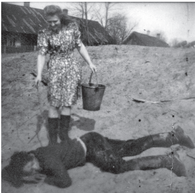
Girtas vyras Zervynų kaime. Spėjama data XX a. pirmą pusę.