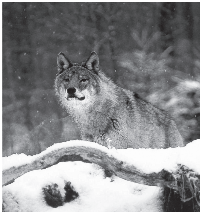
Vilkas ne veltui pasirinktas Čepkelių – Dzūkijos PAN parko simboliu. Kokia būtų Dainavos giria be šių išdidžių miško klajūnų?

Vienok prisimename, kad prieš trisdešimt metų Lietuvoje buvo medžiotojų, kuriems rūpėjo tolimi