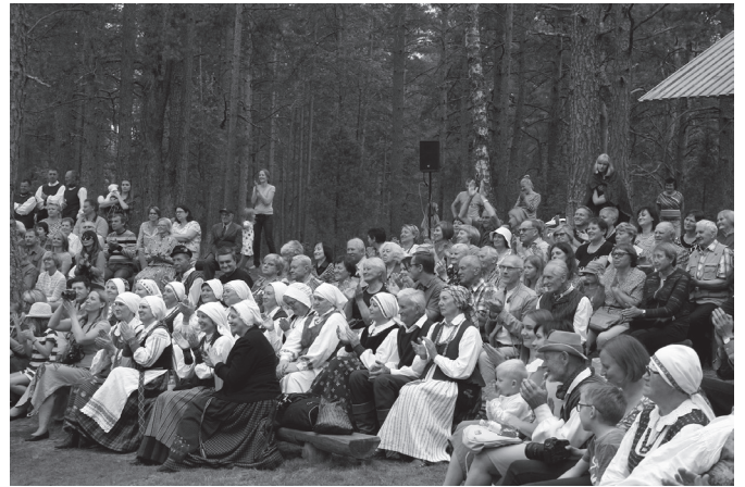
Koncertas prie ežero. Virginijaus PUGAČIAUSKIENĖS nuotrauka, 2017 m.

Penktadienio vakaras. Darželių kaime vėl sujudzimas, rangiamės vakaruškai katron turi suvažuoc ar suaic daugelis festivalio dalyvių ir svečių, katriem nesvecima dzūkiška giesmė, tancus ar ratelis. Rangės vakaruškai – festivalio pradziai visi, kas uslanus statė, kas ugnį kūrė, kas nušienautų žoly grėbstė. Vakaruškai – svecų sucikimui, ruošės ir gaspadinės.