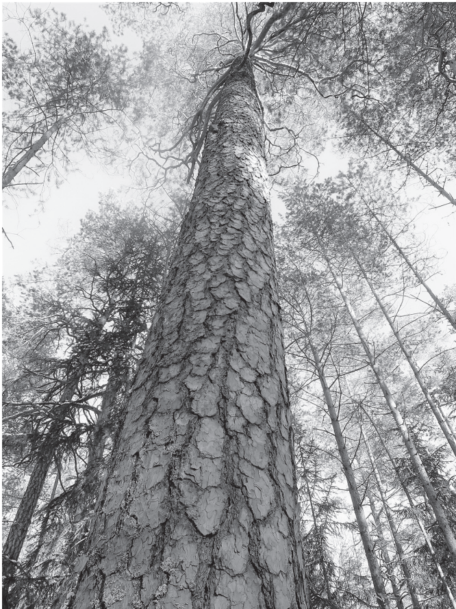
Trečių šimtmetį Čepkelių miške auganti pušis.

Visgi norėtusi labiau paminėti ne pušų dydį (didžiausių pušų Lietuvoje reikėtų ieškoti ne Čepke- liuose ir netgi ne Dzūkijos smėlynuose), o jų amžių. Čepkelių raisto ir miškų nuošalumas, sudėtingas pa- siekiamumas, o vėliau ir rezervato įsteigimas 1975 metais nulėmė, kad čia išliko neiškirsti seni miškai ir pelkėje, ir apyvelkyje, ir raisto salose.