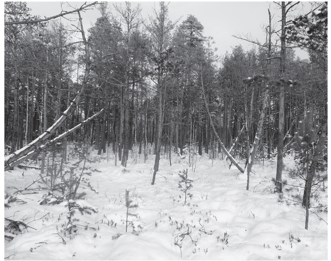
Šimtametės Čepkelių pelkės pušys.

Pagal 2002 metais atlikto Čepkelių valstybinio gamtinio rezervato miškotvarkos projekto duomenis seniausio Čepkelių rezervato medyno amžius šiais 2018 metais siekia 235 metus. Šis medynas yra Čep- kelių rezervato 59 miško kvartale, 21 sklype. Rezer- vate jokie miško kirtimai nevykdomi ir kai kurie seniausi medžiai šiame sklype dabartiniu metu jau nudžiūvę. Dzūkijos nacionalinio parko ir Čepkelių valstybinio gamtinio rezervato darbuotojai, siekda- mi iš naujo patikslinti dabartiniu metu (2018 metais) šiame sklype žaliuojančių medžių amžių, atliko jų amžiaus matavimus. Didžiausias nustatytas pušies amžius čia siekė 229 metus (šio medžio aukštis – 30,5 metrų, kamieno skersmuo 1,3 m aukštyje – 58 cm, apimtis – 188 cm).