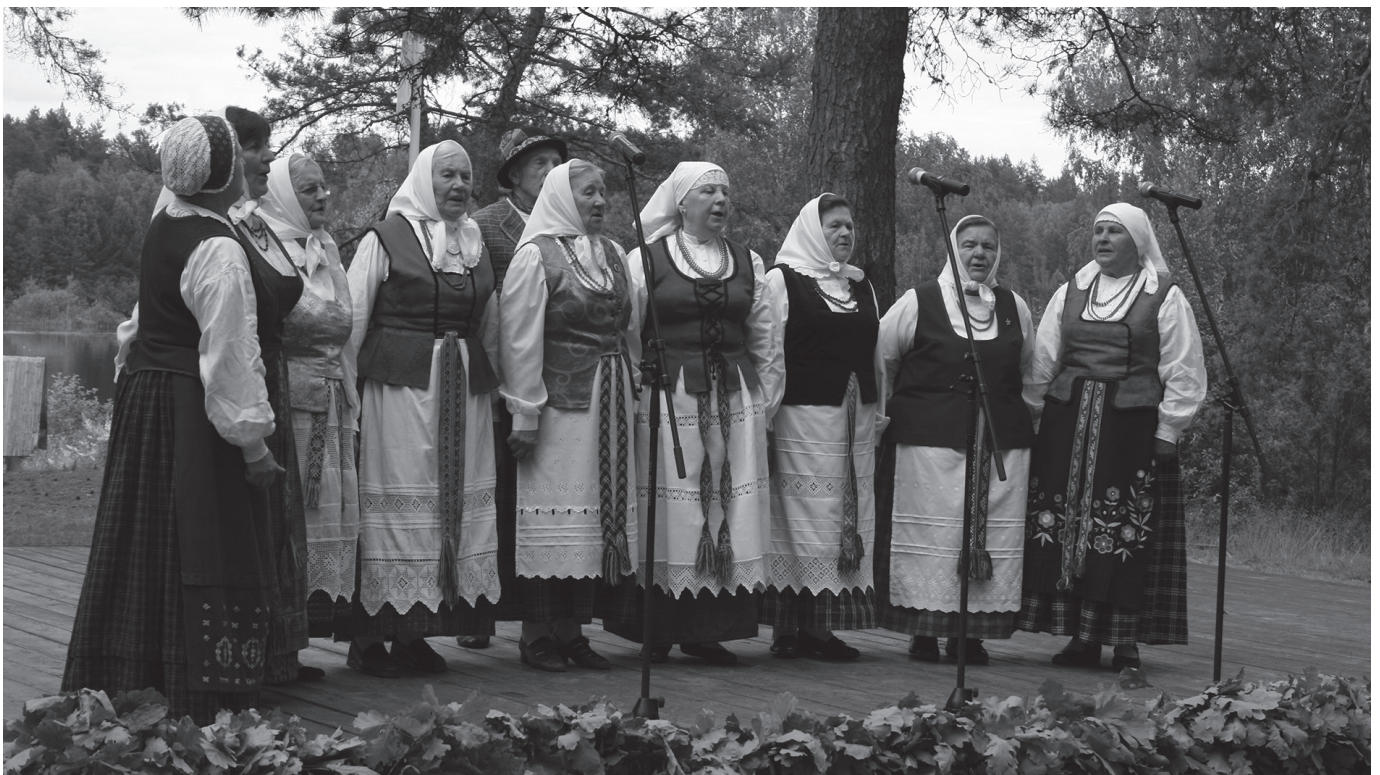
Marcinkonių etnografinis ansamblis. Virginijaus PUGAČIAUSKIENĖS nuotrauka, 2017 m.

Kitų dzienuų kėlėmės anksi. Ba rakė ūžuolo lapų vainikai pync, o tuoj darbu užsijėmė svecai iš Klaipėdos – pynė vainikų Darželiuose, vilniškiai ir radviliškiečiai – Marcinkonyse. Vienu vainiku parėdėm