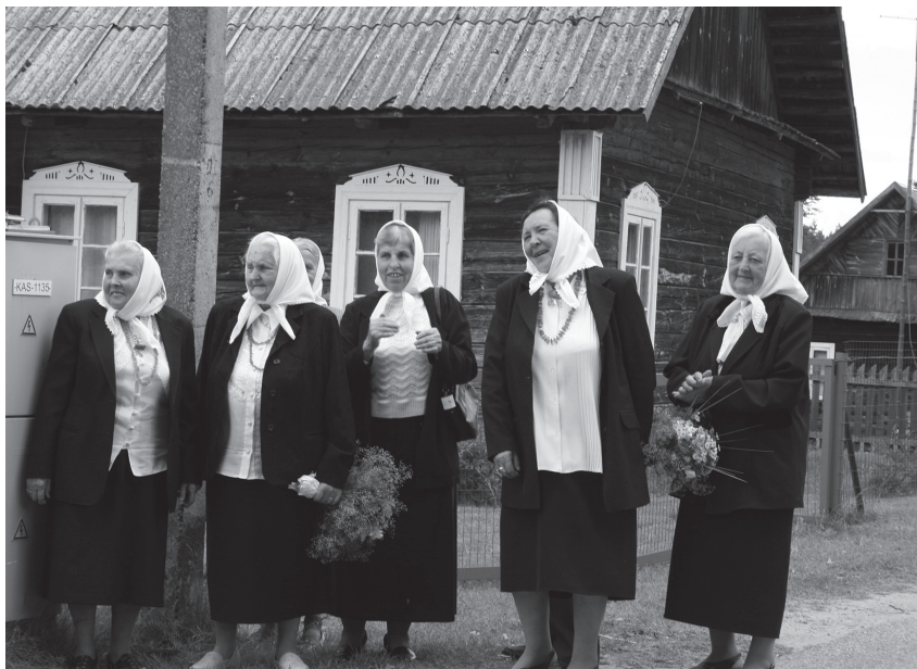
Lynežerio kaimo daininkės. Virginijaus PUGAČIAUSKIENĖS nuotrauka, 2017 m.

Sekmadienis buvo spakainesnis. Po Šv. Mišių