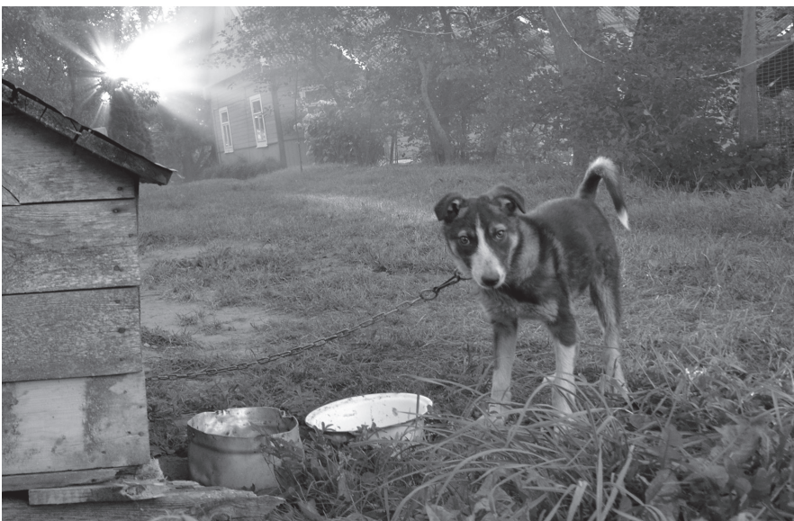
Kiemsargio rytas. Brolių ČERNIAUSKŲ nuotrauka, 2017 m.