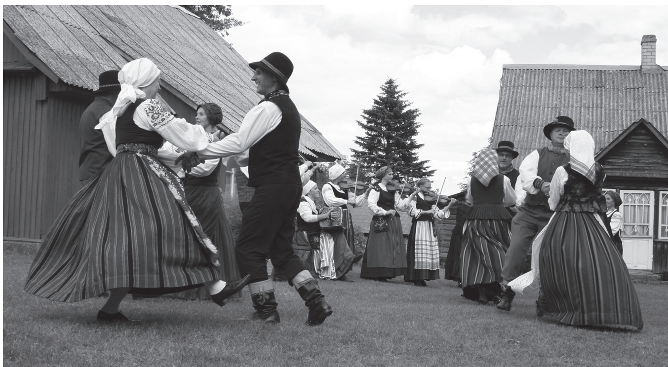
Šoka „Kuršių ainiai“. 2017 m.