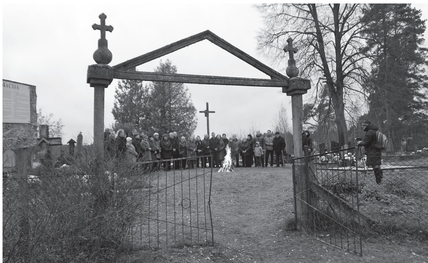
Vėlinės Mardasavo kaimo kapinėse. 2017 m. Vėlinių laužai Parko teritorijoje liepsnojo Margionių ir Mardasavo kaimo kapinėse.