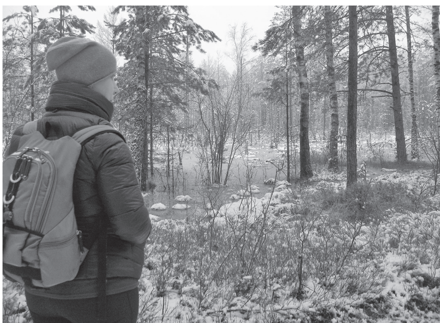
Tokiais Čepkelių raisto vaizdais gėrėjosi ir profesorius Tadas Ivanauskas. Miškų telmologinis draustinis.