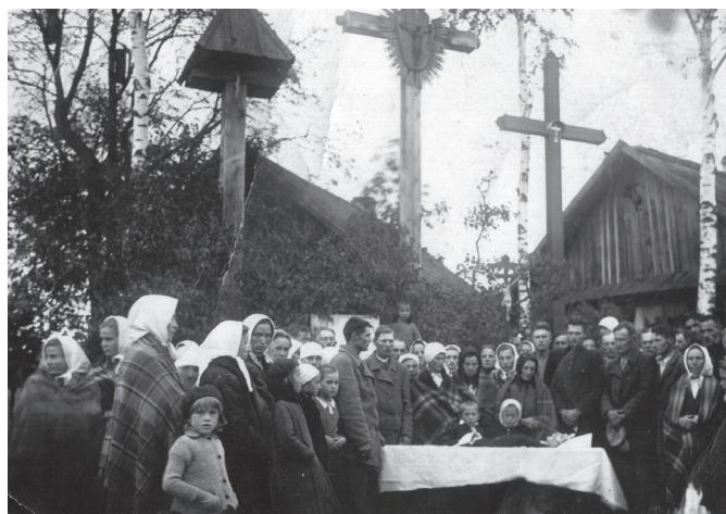
Laidotuvės Žervynų kaime XX a. pirmą pusę.