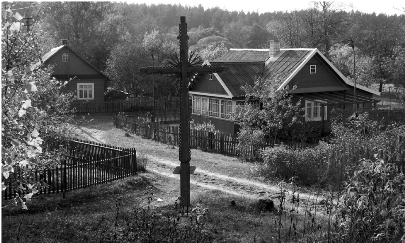
Trakiškių kaimas.