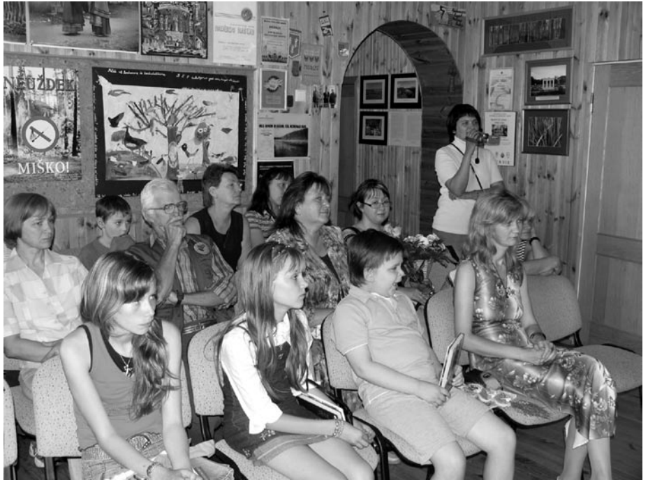
Parodos atidarymo akimirka