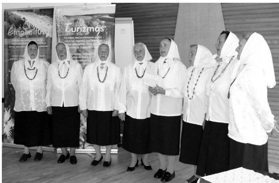
Lynežerio kaimo moterys padainavo ne vieną partizaninę dainą