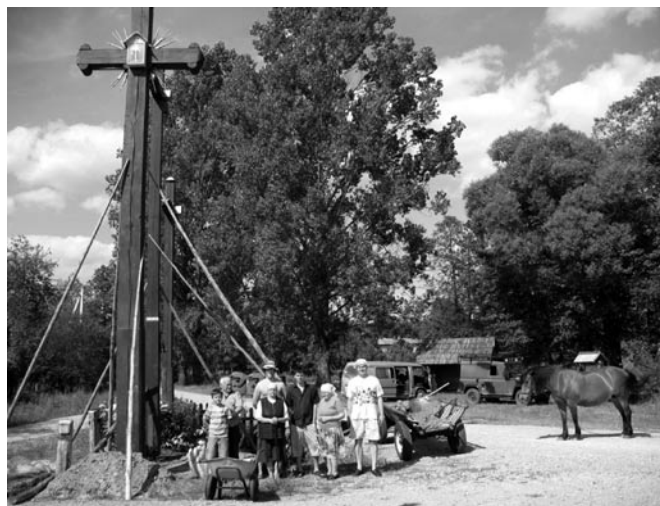
Pastačius kryžių Musteikoje.