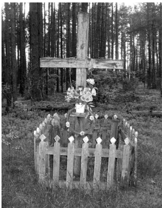
Kryžus Katros kaimo gale.

„Viso kaimo moterys susirinko, verpė siūlus, užmetė, per parą ką padarė, tą padarė. O paskui dar liko neišauštų siūlų, tai apėjo visą kaimą aplinkui su likusiais siūlais, tiek, kiek jų užteko. Kryžius stovėjo, ten buvo sankryža, tai apnešė ties ja. Išauštą drobę nunešė į cerkvę. Senas kryžius jau nukrito, tai naują aš padariau toj pačioj vietoj.“