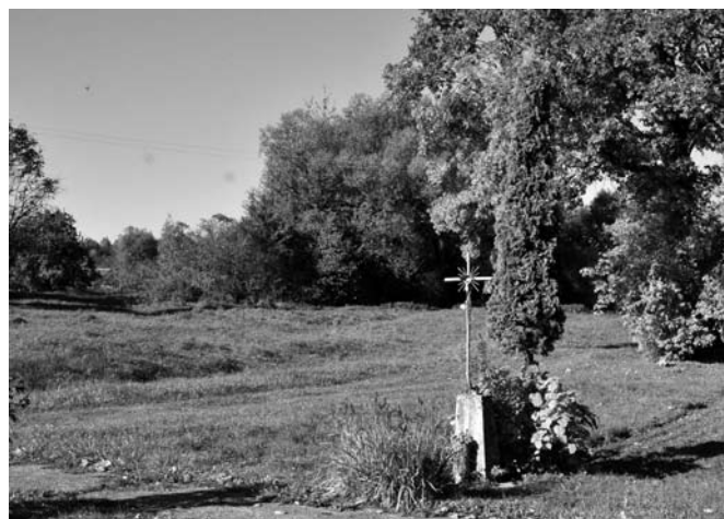
Rožės Čiurlionytės kryžius 2013 m.

Po karo Liškiavos klebonas Kriškčiūnas visiems prie namų liepė kryžius statyti, matyt, nujautė, kad veš. Tai visi buvo pasistatę savo kiemuose kryžius. Kunigas, kai važiuodavo su arkliu, tai prie liesinės buvo pritvirtinęs geležinę dėžę su žarijom. Tai jis ten ant tokios vielos buvo metus pasidaręs ir ant tų kryžių tuos metus ir išdegindavo.