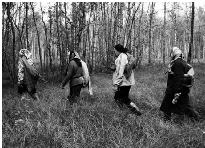
Krokšlio kaimo spanguoliautojos pakeliui į raistą.

Spalgienas vežodavom po Gardzinų, sciklinaitėm pardavinėjom, o paskui veždavom Vylniun, pūnkta nepirkdavo, ir pamažu pamažu, tai tį, tai tį, tai pirkdavo, o iš pyrmo ne. Kap veždavom, tai myltų parsiveždavom, iš produktų, iš maisto, nu nusperki būdavo kokių skepataitį, ar kokias kojinaites, gi nebuvo. Kici visai sunkiai gyveno, tai an pilvo cik.