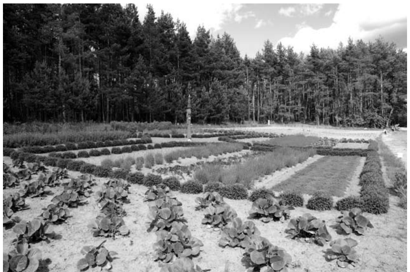
Pilnų namų bendruomenės įkurtas Herbariumas miškų apsuptyje vieniemyje prie Panaros. Brolių ČERNIAUSKŲ nuotrauka, 2012 m.

puodus, kurie net ugnies nebijo, taip pat ne šventieji lipdo. Taip ir sugrižta senovė. Ne visur taip sparčiai, kaip norėtume, bet sugrižta, ir kaip nesunku patikėti, kad kiekviena tokia kūrybinga diena vis nutolina tą pranašaujama pasaulio pabaigą. Nėra kada ir galvoti apie tą virtualią „pabaigą“, kai kiekvienas tavo prijaukintas augalėlis, kiekvienas gyvūnas reikalauja globos.