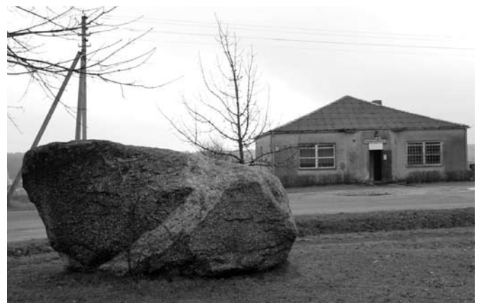
Šis granito akmuo vadinamas Panaros rieduliu yra akivaizdus ledynmečio galdynės liudininkas.

Ne tik vaistažolė, bet ir daržovė, užaugusi savame senoviškame kieme, yra ir maistas, ir vaistas. O kai tų vaistažolių, daržovių, vaisių, uogų bei prieskoninių augalų yra daug, tai šitokia biologinė įvairovė atrodo jau tikras Rojus. Darbo, žinoma, irgi daug, bet kiek čia ramybės, grožio ir pasitikėjimo – viską gali susikurti pats, nusipirkęs tikrai kastuvą, sekatorių, kauptuką... Bet vėlgi: kauptuką gali nukalti kaimynas, o