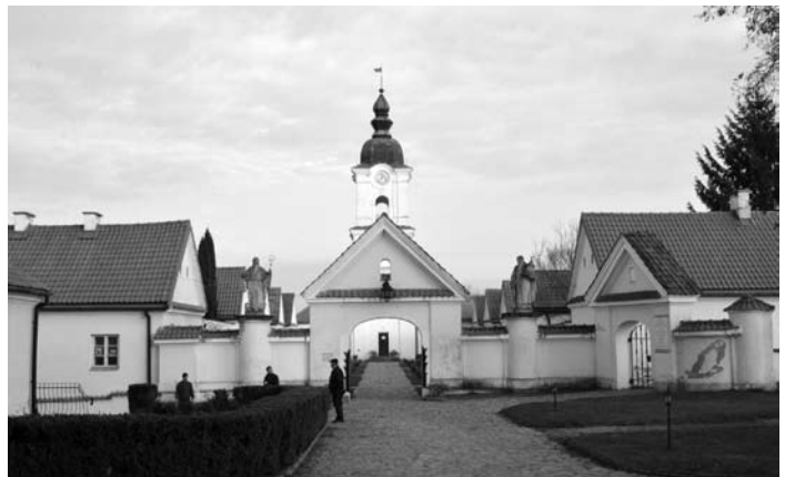
Restauruotas kamaldulių vienuolynas Vygiuose primena senovę.

Prieškariniai Liškiavos pilies griūvėsiai.