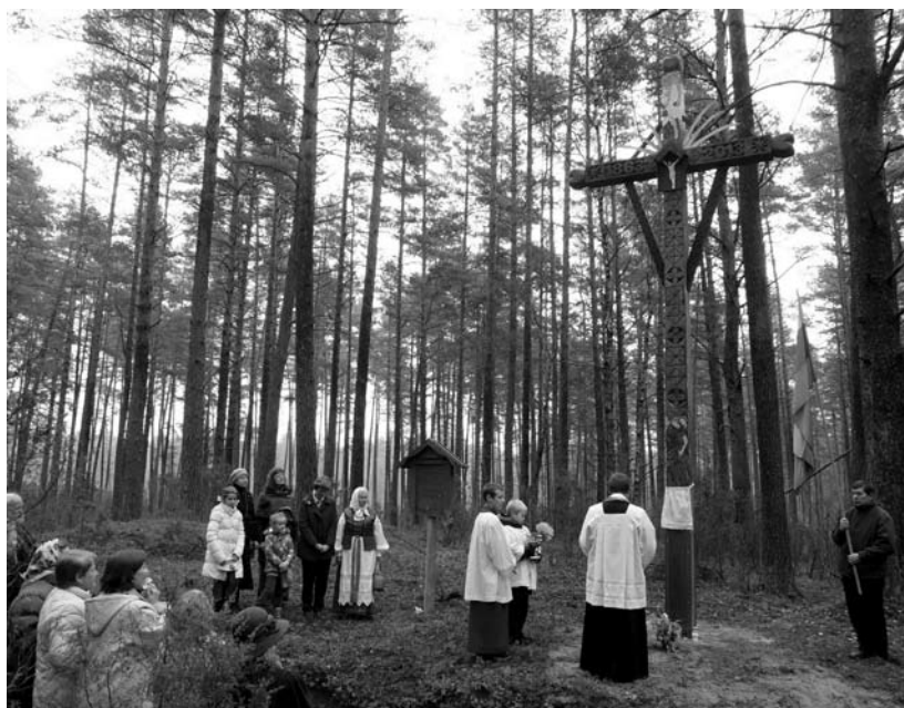
Spalio 27 d. Marcinkonyse, švenčiant Šv. apaštaly Simono ir Judo atlaidus, istorinėje vietoje – Šventose Eglėse (pusiaukelėje tarp Marcinkonių ir Zervynų) – pašventinti du atstatyti kryžiai.

2013 m.