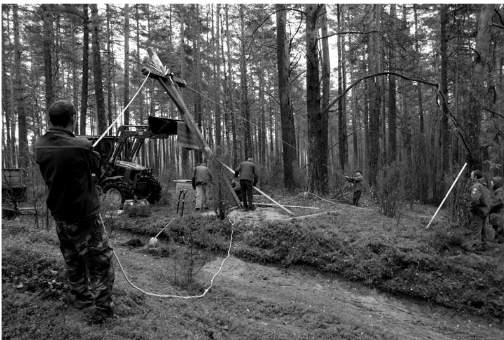
Kryžiaus statymas prie Šventų eglė. Ričardo SINKEVIČIAUS nuotrauka 2013 m.

Tačiau rusų karinė vadovybė ėmėsi visų priemonių sustabdyti sukilimą, už L. Narbuto galvą buvo paskirta solidi 1000 rublių suma ir sukilėlių vadas buvo išduo-