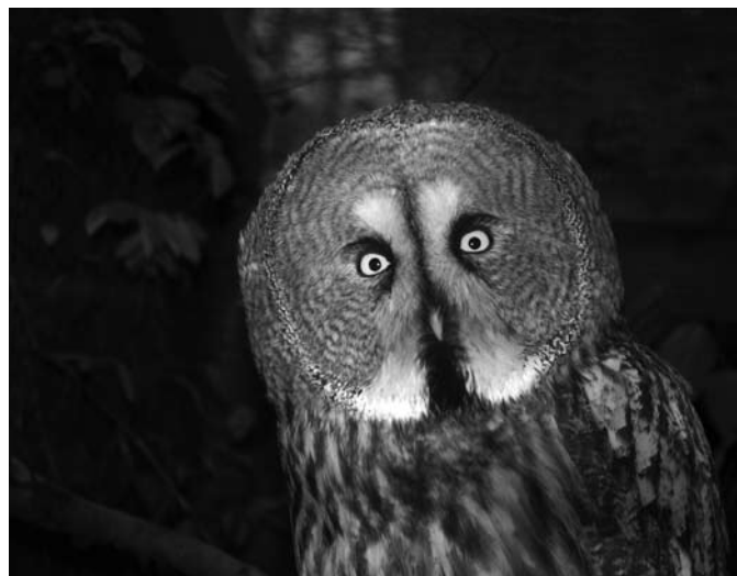
Laplandinė pelėda.