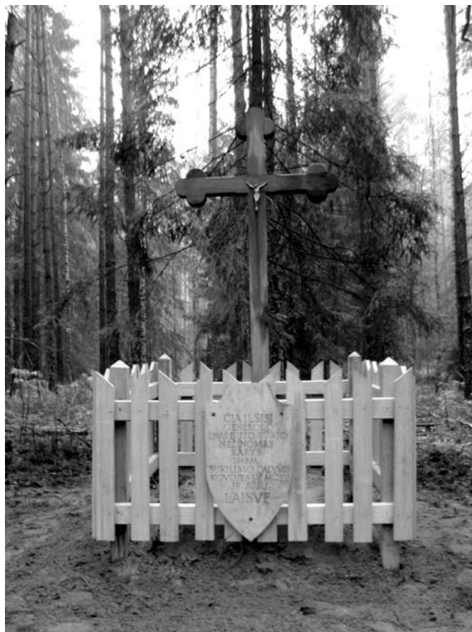
Užrašas ant kryžiaus Čepkeliuose: „ČIA ILSISI GENEROLO L. NARBUTO BŪRIO NEŽINOMAS 1863 M. SUKILIMO DALYVIS, KOVOJĖS UŽ MŪSŲ IR JŪSŲ LAISVĘ“. Egidijaus ŽUKAUSKO nuotrauka 2013 m.