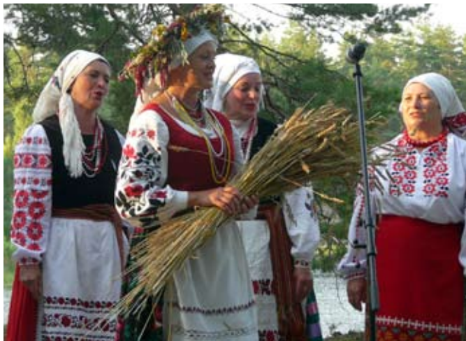
Svečiai iš Ukrainos folkloro ansamblis „Kalina“. Rugiapjūtės pabaigtuvių inscenizacija

Viso folkloro festivalio „Subatėlės vakarėly...“