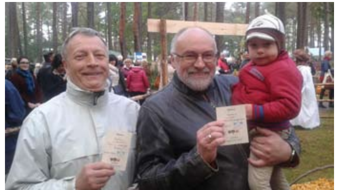
Grybų žinovai.

Mažiesiems parengėme įvairių mįslių, bandėme sužinoti kaip valgomasias voveraites ar kazlėkus vadina vietiniai grybautojai. Viktorinoje dalyvavo ir maži ir dideli. Geriausiai atsakę gavo ne tik grybų žinovo diplomą, bet ir nemokamą pažintinę kelionę – ekskursiją po Dzūkijos nacionalinį parką ir Čepkelių rezervatą.