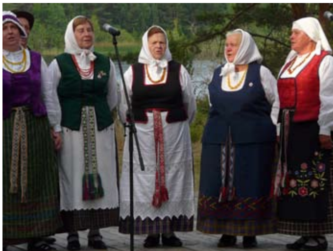
Dainuoja Marcinkonių etnografinio ansamblio moterys