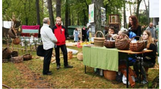
Moksleiviai „Grybų šventėje“.