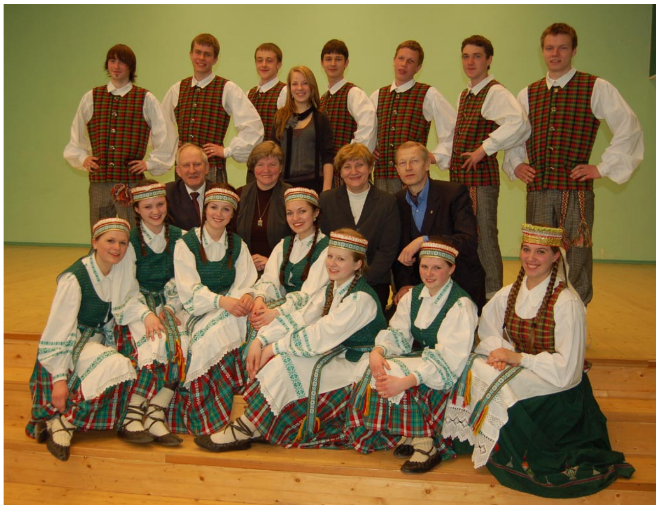
Vytauto Černiausko fotografijos, 2011