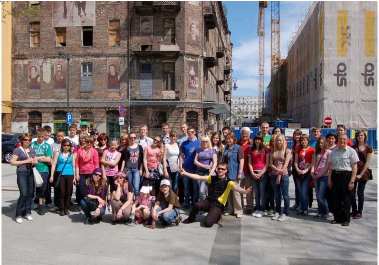
Mūsų grupė, šalia vieno iš nedaugelio karą išgyvenusio pastato.