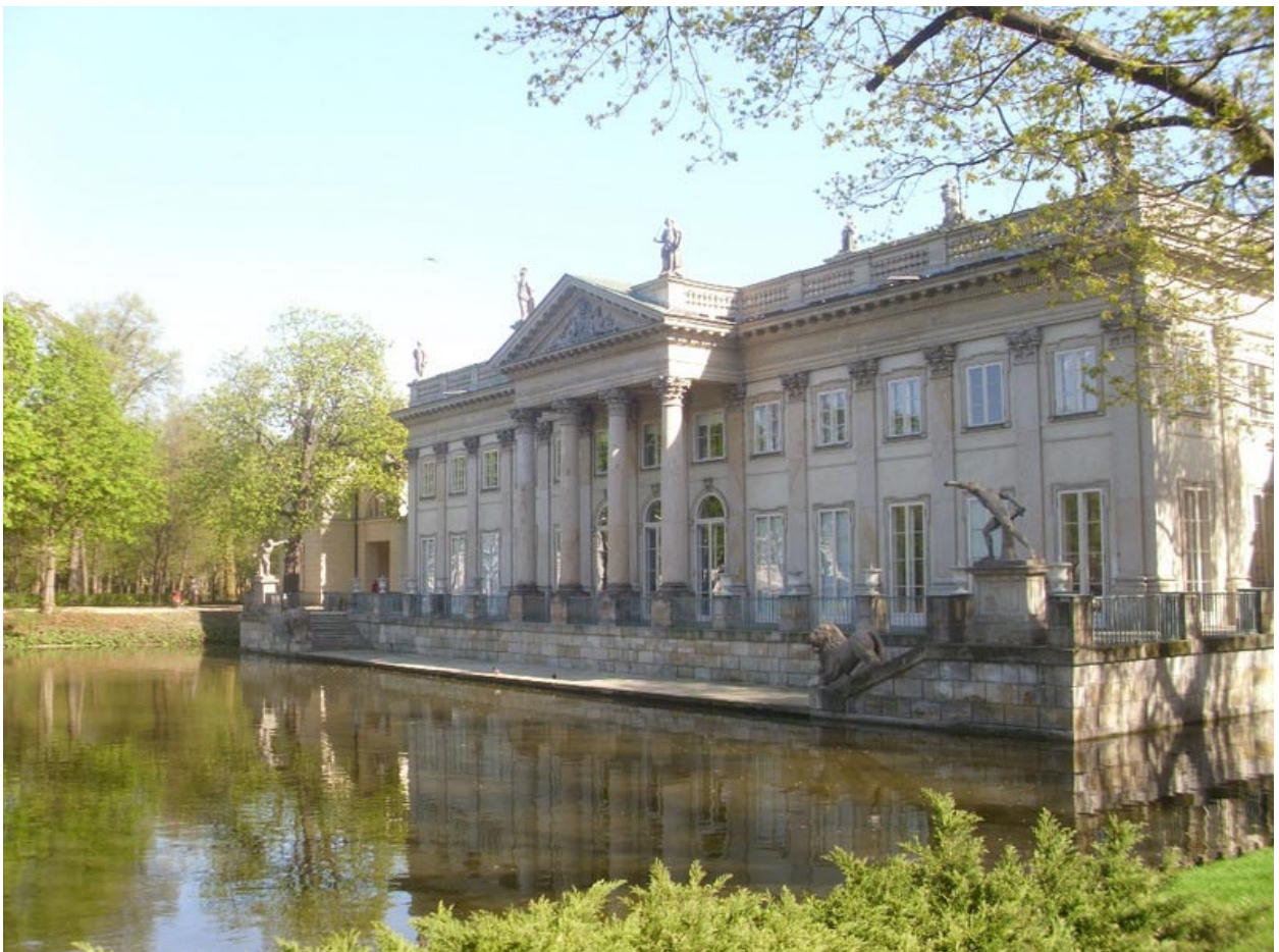
Paskutinis Lenkijos karalius S. A. Poniatowskio įkūrtas didžiausias, bei gražiausias Varšuvos parkas „Lazienki“.