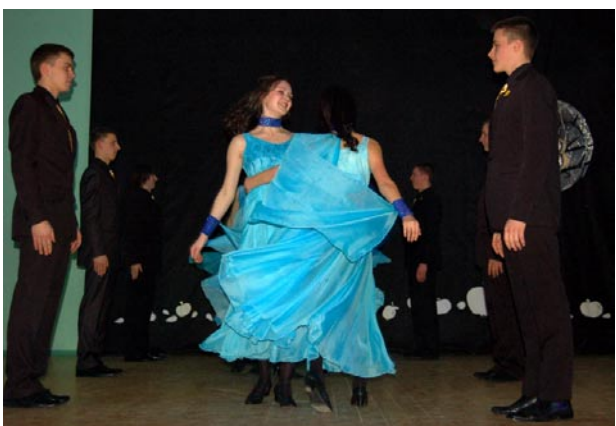
Šimtadienio akimirkos.