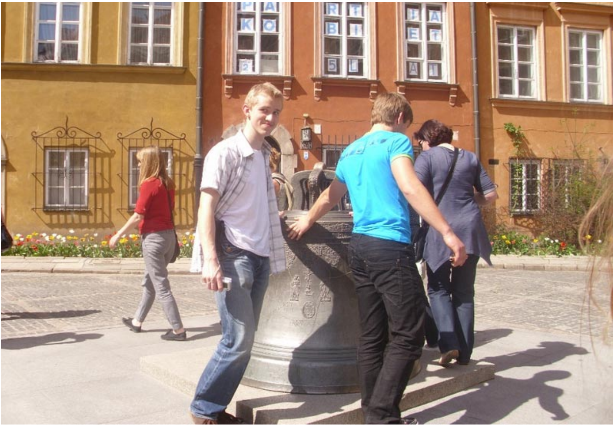
Apėjus šį varpą tris kartus, galima tikėtis norų išsipildymo...