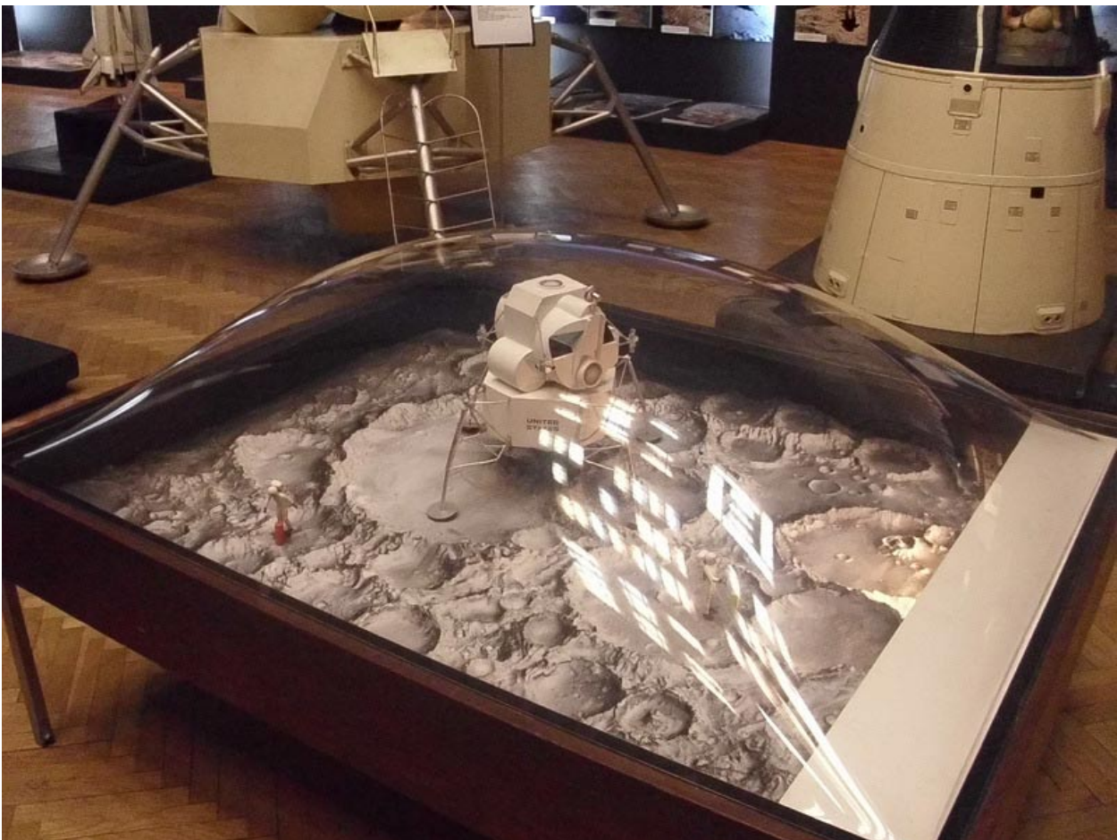
Viena iš daugelio Varšuvos Technikos muziejaus ekspozicijų.